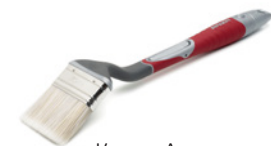
Кисть Anza Elite Radiator