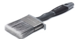
Кисть Anza Platinum Flat