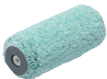
Валик Anza Platinum Micromex