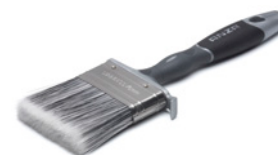
Кисть Anza Platinum Flat