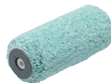
Валик Anza Platinum Micmex